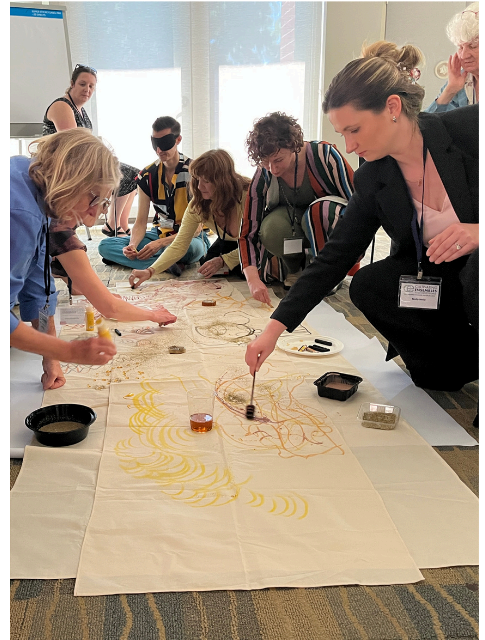
Performance/ happiness - O sol nas asas delas Burburinho da Sustentabilidade: Arte, Abelhas e Consciência Planetária 25/07/2025 - 10:00 am Saint Elizabeth University Morristown, New Jersey, United States